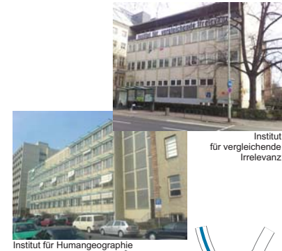
Institut für vergleichende Irrelevanz